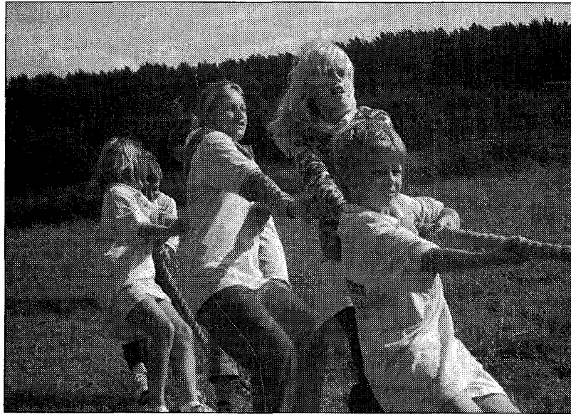
Team Hawaï trok bij het tenniskamp 2008 aan het langste eind.