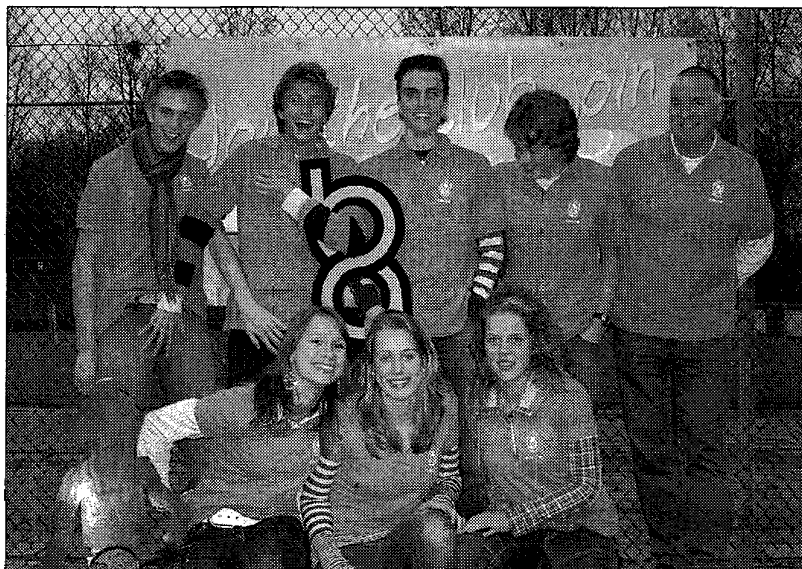
De Kwikkers zijn helemaal klaar voor het K4-toernooi.