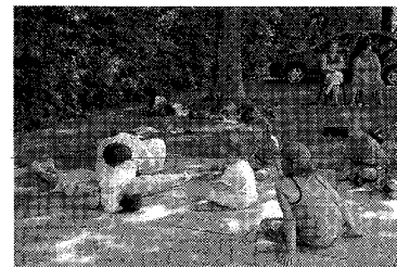
Spannend om mee te doen met judo