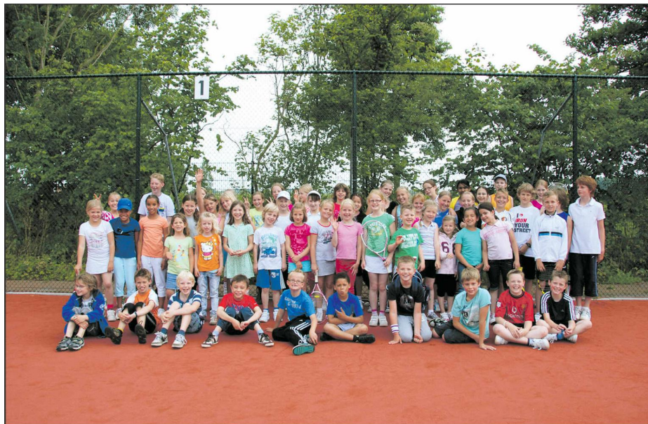
Aan de kindermiddag bij Bequick werd door meer dan 50 kinderen meegegaan.