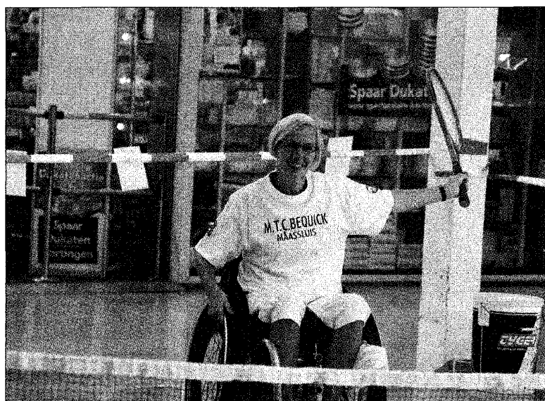
Nieuw bij Bequick: rolstoeltennis