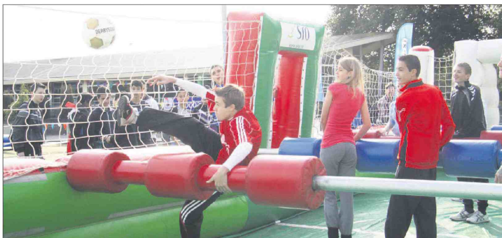
● Levend tafelfoetbal viel bij jongens en meisjes in de smaak en zorgde voor spannende taferelen.