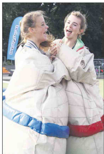
● Met elkaar sumoworstelen.